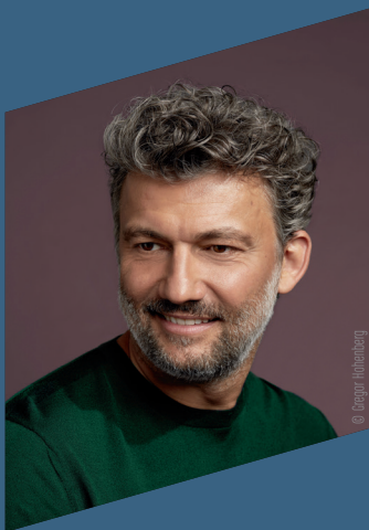
Jonas Kaufmann Tenor